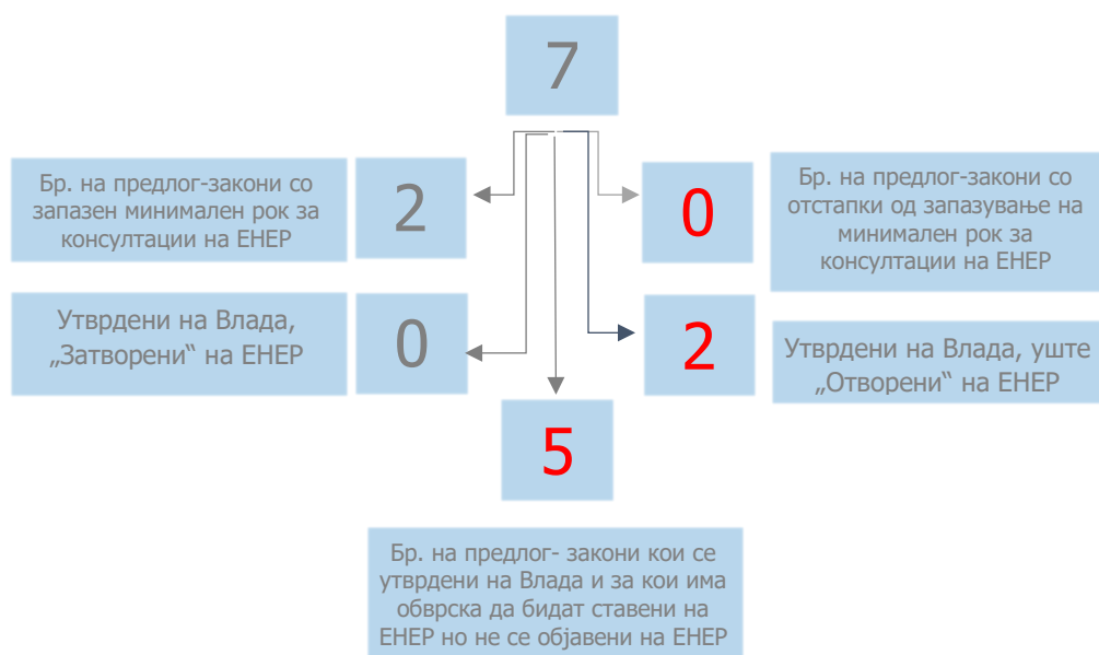
Табела. Преглед на објавени предлог-закони по министерства и почитување на обврската за консултации со јавноста на ЕНЕП

Предлог-закони утврдени на седница на Владата во период од 1 до 31 октомври 2018 г.